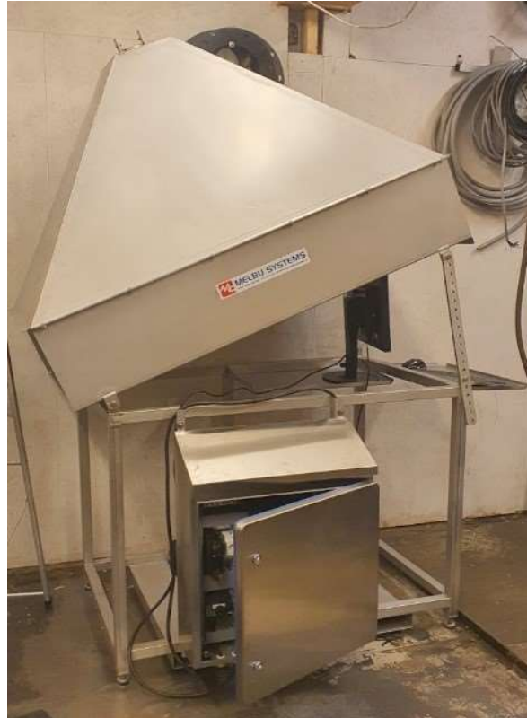
Figur 1. Prototype skanner fra Melbu Systems AS

Pga. dårlig vær ble det første ordinære forsøket utsatt, og ved neste mulighet 26.mai 2021 var det kun mulig å kjøre test fra merd til merd, og ikke fra båt til merd slik det var opprinnelig planlagt. Skanneriggen måtte ombygges noe, slik at det lot seg gjøre å stå støtt på merden i stedet for å henge på rekkverket til en båt. På forsøket ble det sendt 550 stk. torsk gjennom skanneren der 50 stk. av disse ble veid individuelt og de 500 stk. andre batchvis fordelt over 16 batcher. Fisken ble trengt i merden før den ble håvet ut i en stor håv. Videre ble en og en fisk sluppet ned på sorteringsbordet før fisken ble ledet gjennom skanneren og så ned i merden igjen.